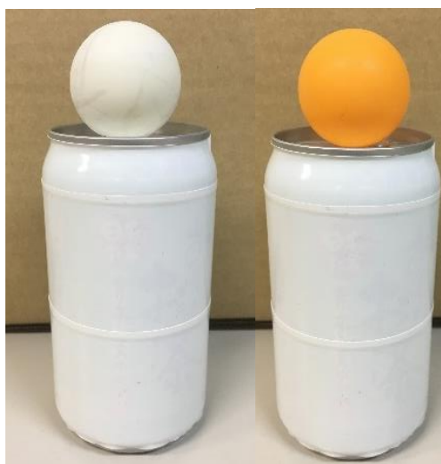
図 3 使用する飲料缶とピンポン球の置き方