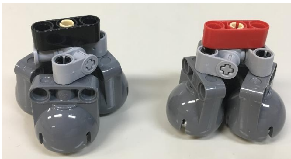
図 2 ストーンの概観